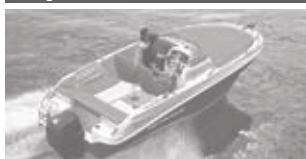
Cap Camarat 5.5 WA