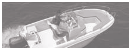
Cap Camarat 4.7 CC