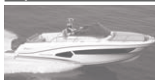
Cap Camarat 10.5 WA