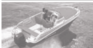
Cap Camarat 5.5 WA