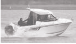
Merry Fisher 605