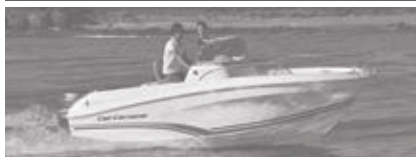
Cap Camarat 6.5 CC SERIE 3