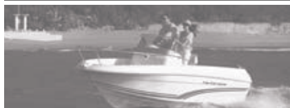
Cap Camarat 5.5 CC