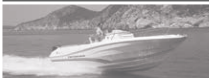
Cap Camarat 9.0 CC