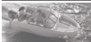
Cap Camarat 5.5 BR