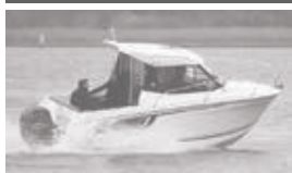
Merry Fisher 605