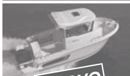
Merry Fisher 605 marlin