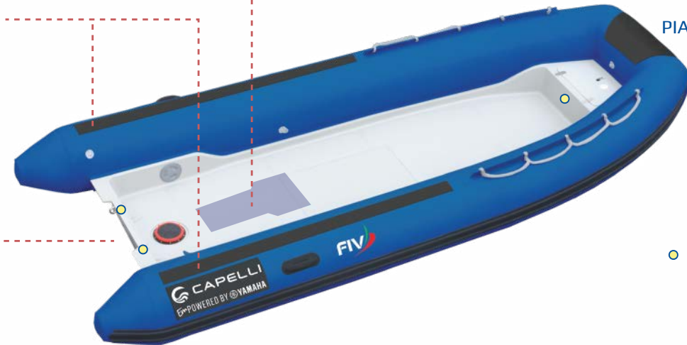
PIATTINA RIGATA PRUA