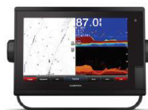
GPSMAP 722, 922 GPSMAP 1222 Touch